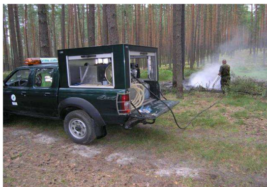
Ryc. 1 Pożar lasu